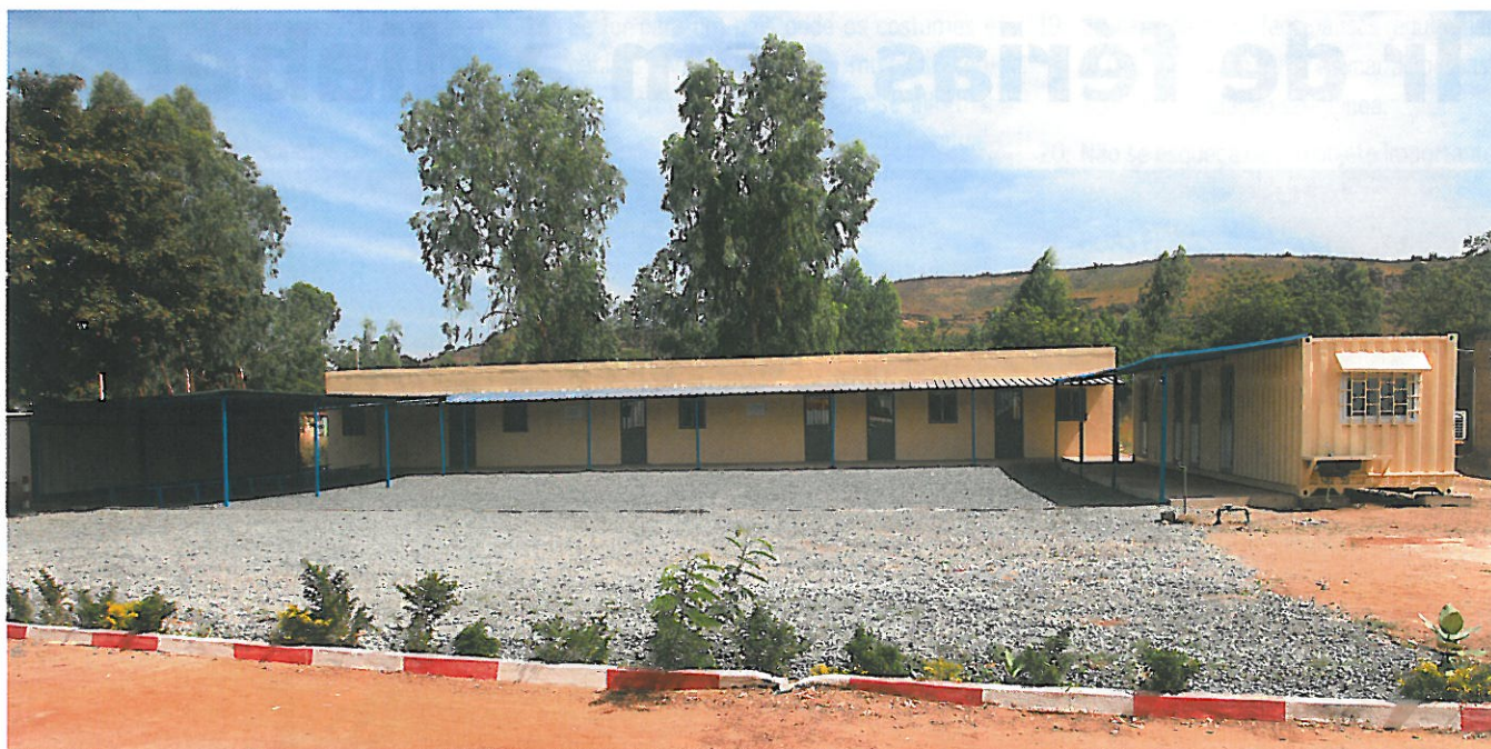
Nouvelle unité de prise en charge des enfants atteints de diabète de type 1 à l'hôpital du Mali (Bamako)